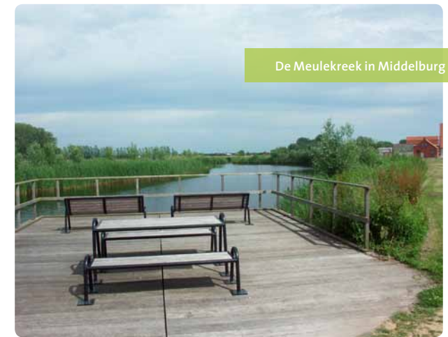
De Meulekreek in Middelburg