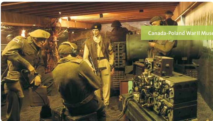
Canada-Poland War II Museum