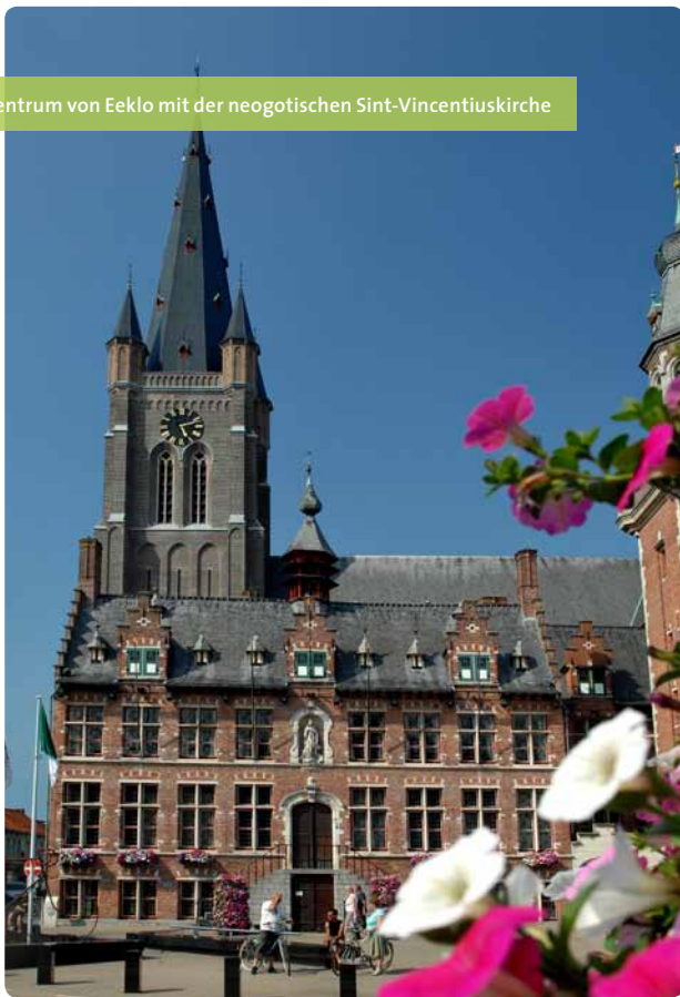
Das Zentrum von Eeklo mit der neogotischen Sint-Vincentiuskirche