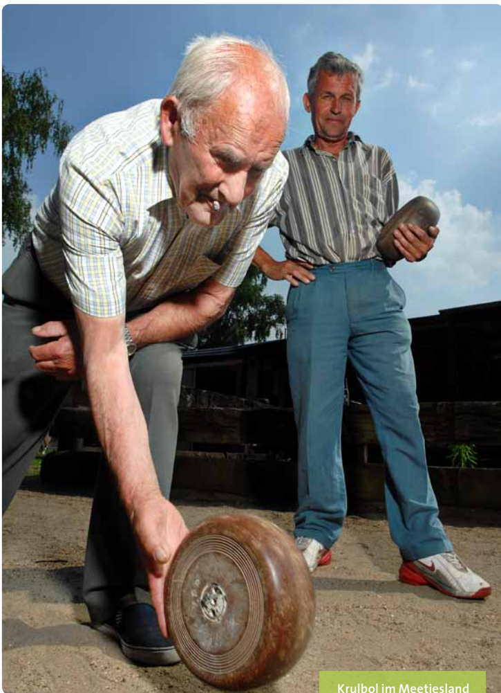
Krulbol im Meetjesland