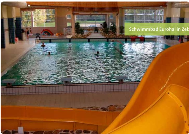
Schwimmbad Eurohal in Zelzate