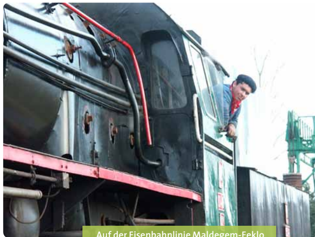
Auf der Eisenbahnlinie Maldegem-Eeklo

Für den Fahrplan können Sie sich an die Fremdenverkehrsämter vom Meetjesland wenden oder im Voraus telefonisch Kontakt aufnehmen.