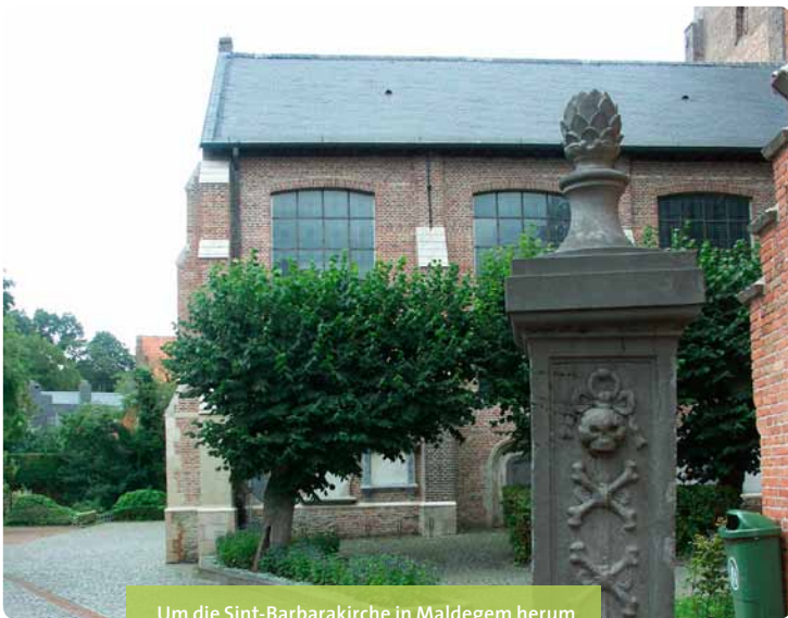
Um die Sint-Barbarakirche in Maldegem herum