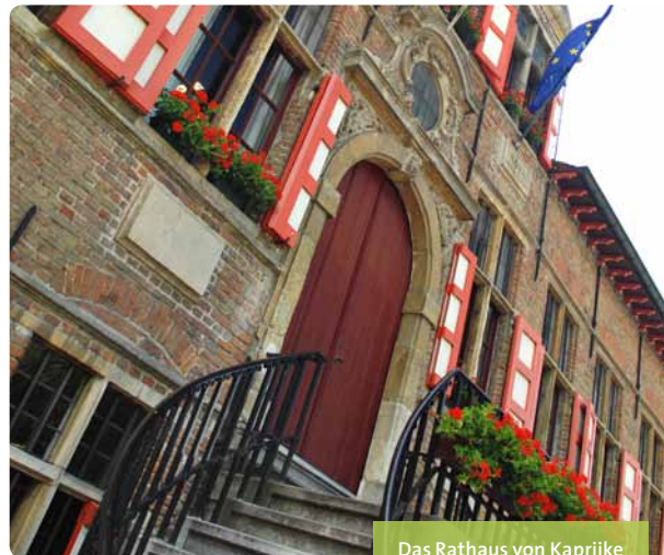
Das Rathaus von Kaprijke

Toerisme Kaprijke, Plein 1, 9970 Kaprijke T +32 9 323 90 54, toerisme@kaprijke.be www.kaprijke.be (zwischen Knotenpunkt 79 und 74)