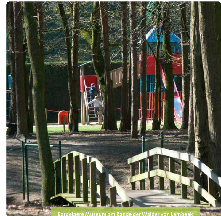
Bardelaere Museum am Rande der Wälder von Lembeek

Weitere Informationen ebenfalls beim Fremdenverkehrsamt von Kaprijke erhältlich (T +32 09 323 90 54)