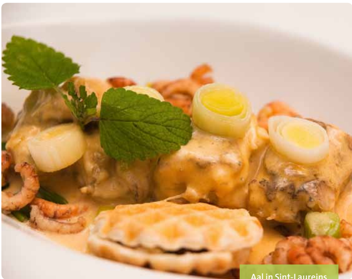
Aal in Sint-Laureins