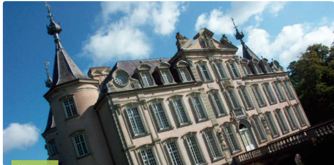
Schloss von Poeke

Toerisme Sint-Laureins Dorpsstraat 87, 9980 Sint-Laureins T +32 9 218 76 47 kathleen.seynhaeve@sint-laureins.be www.sint-laureins.be