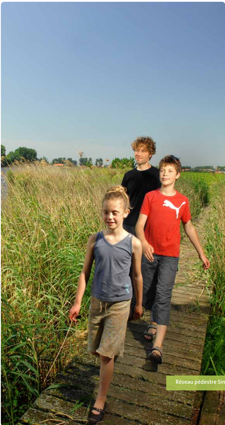
Réseau pédestre Sint-Maria-Aalter