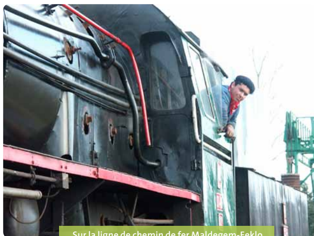
Sur la ligne de chemin de fer Maldegem-Eeklo

Pour connaître l'horaire des trajets, n'hésitez pas à contacter un bureau d'information touristique du Meetjesland ou à téléphoner à l'avance au Centre de la Vapeur.