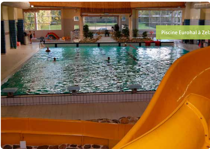
Piscine Eurohal à Zelzate