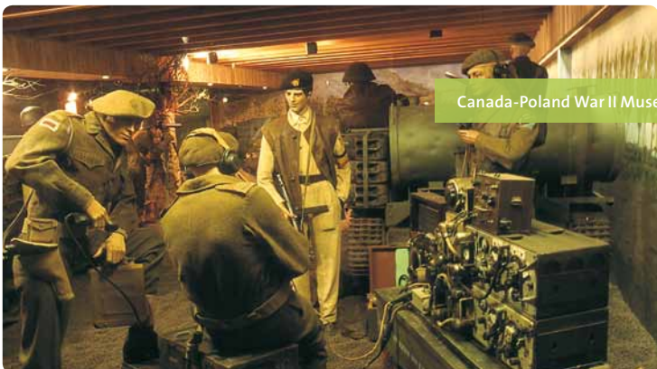
Canada-Poland War II Museum