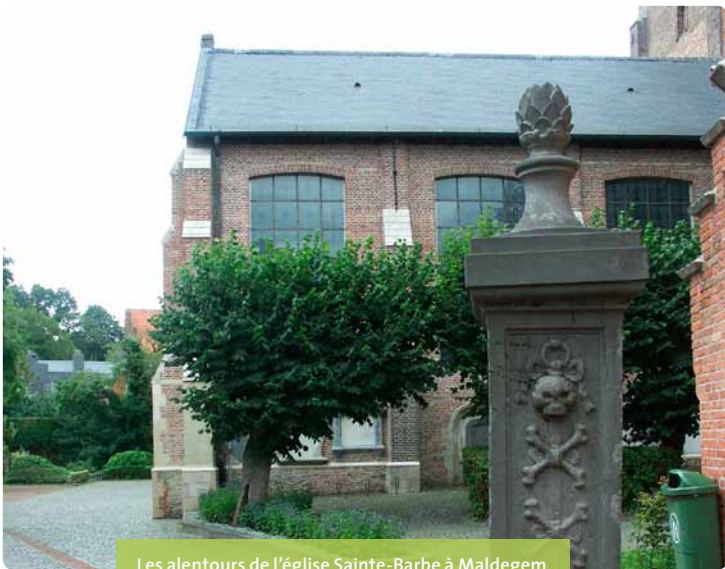
Les alentours de l'église Sainte-Barbe à Maldegem