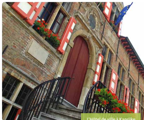
L'Hôtel de ville à Kaprijke

Toerisme Kaprijke, Plein 1, 9970 Kaprijke T +32 9 323 90 54, toerisme@kaprijke.be www.kaprijke.be (entre les points de jonction 79 et 74)