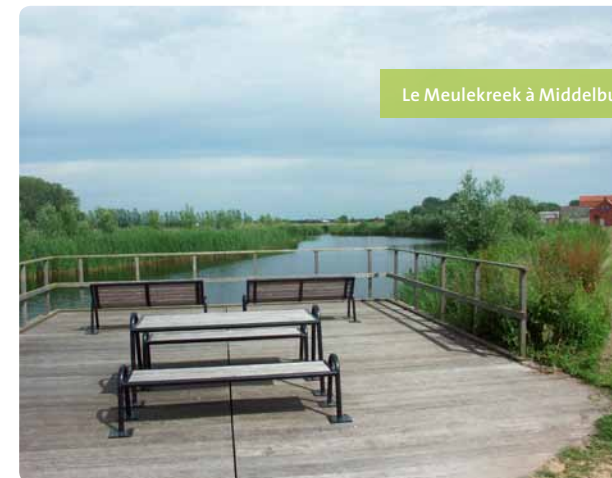
Le Meulekreek à Middelburg