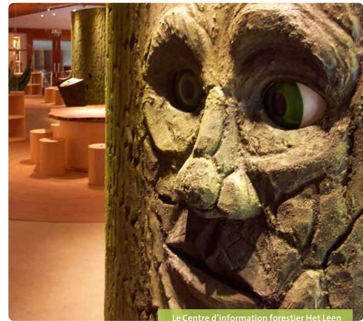
Le Centre d'information forestier Het Leen

Provinciaal Domein Het Leen Gentsesteenweg 80, 9900 Eeklo T +32 9 376 74 74 het.leen@oost-vlaanderen.be