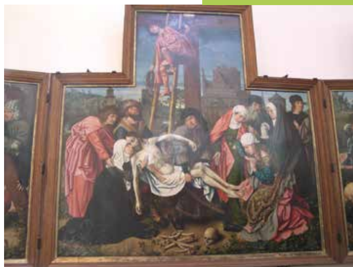
Le Maître de Francfort à Watervliet

Suivez le réseau pédestre et faites le parcours: 54-28(NL)-45(NL)-53-54