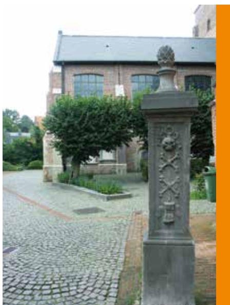
Les alentours de l'église Sainte-Barbe à Maldegem