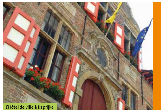
L'Hôtel de ville à Kaprijke

Info Toerisme Kaprijke, Veld 1, 9970 Kaprijke, T +32 9 323 90 54, toerisme@kaprijke.be , www.kaprijke.be (entre les points de jonction 79 et 74)