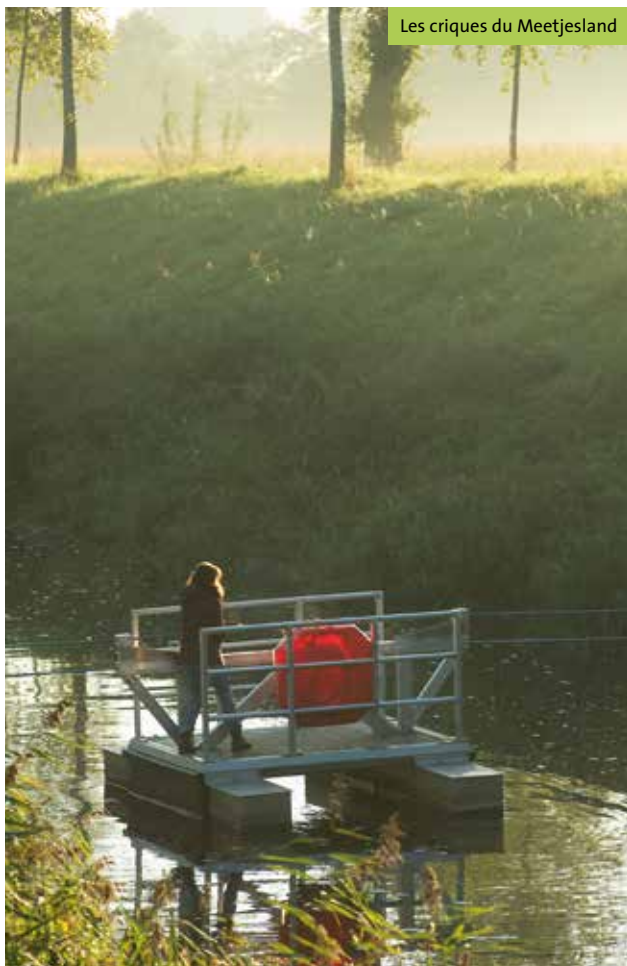
Les criques du Meetjesland

Info Zwembad Eurohal Zelzate, Oostkade 1, 9060 Zelzate, T +32 9 345 74 22