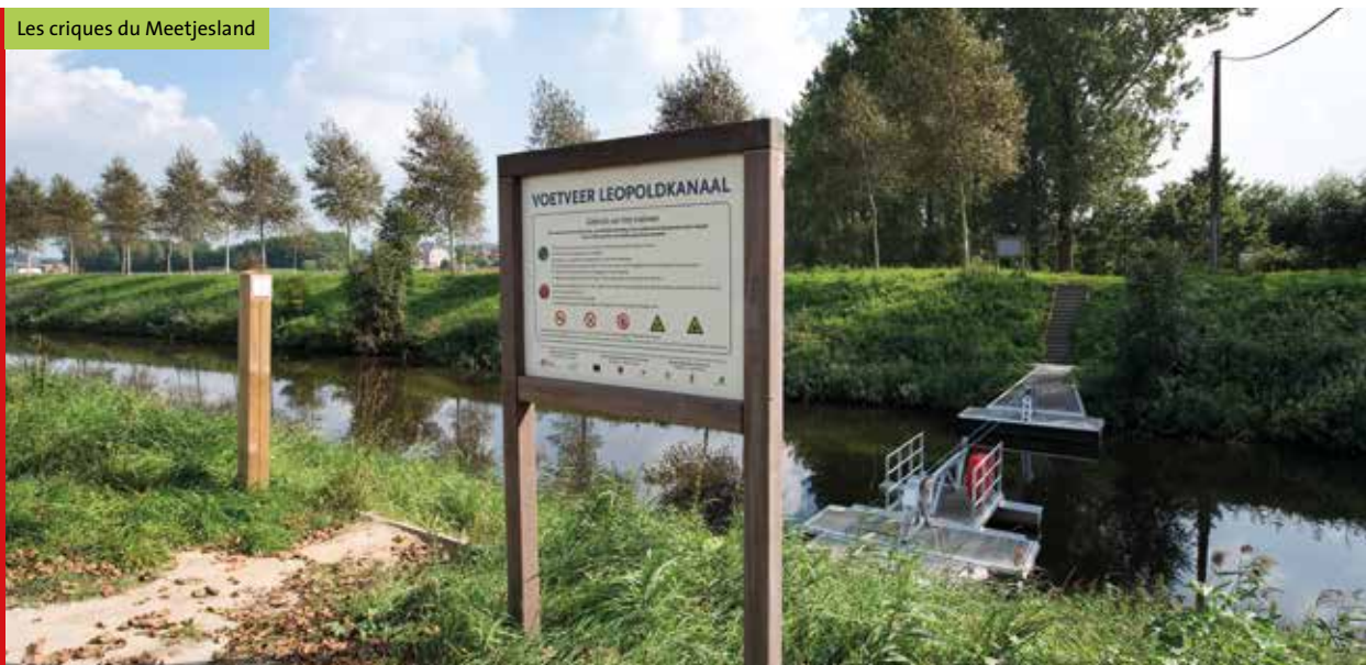
Les criques du Meetjesland

Infos Les cartes des réseaux pédestres dans le Meetjesland sont en vente dans tous les bureaux d'information touristique des Flandres Orientales au prix de 6 euros. Vous pouvez aussi le commander sur le site www.toerismemeetjesland.be . La carte est uniquement rédigée en néerlandais mais toute personne non-néerlandophone qui connaît le système des points de jonction, peut néanmoins l'utiliser immédiatement. Online routeplanner sur le website.