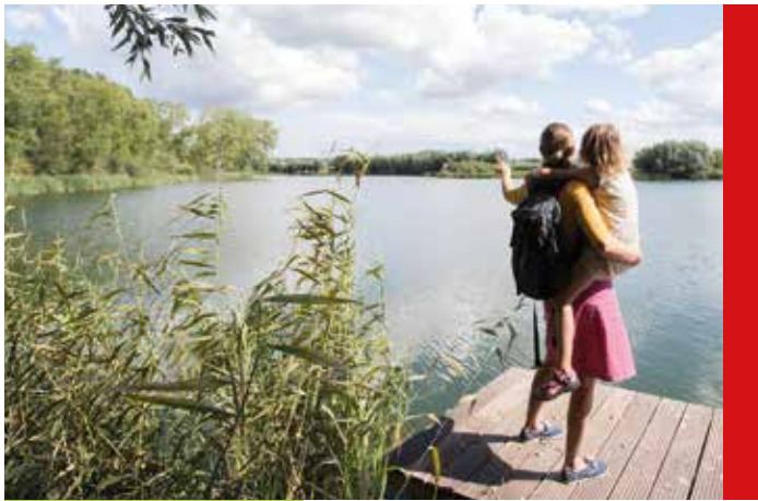
Les criques nous parlent

les pêcheurs et les hérons règnent en maîtres. Vous démarrez cette randonnée au centre de Waarschoot, à l'église Saint-Ghislain. Suivez ensuite les panneaux à partir du centre de Waarschoot.