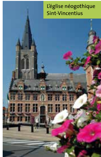
L'église néogothique Sint-Vincentius

Info Centre d'information des visiteurs 'Boekhoute et ses pêcheurs', Boekhoutedorp 3, 9961 Boekhoute, T 09 373 60 08, toerisme@assenede.be , www.assenede.be