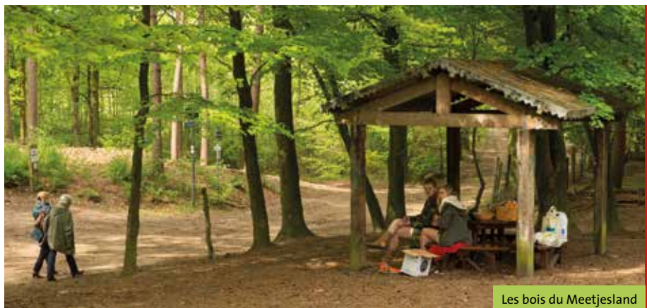
Les bois du Meetjesland

Les criques et polders au nord sont magnifiques pour faire des promenades. Le réseau pédestre se situe entre Middelburg, une petite ville médiévale à la frontière belge à l'ouest, presque jusqu'à la ville de Zelzate avec sa Grande Place, ses petits cafés sur Port de Gand à l'est. Un réseau pédestre avec des criques, des digues et des polders. Le silence est partout. L'environnement est incroyable. On découvre la crique 'Boerekreek' (6 km) et les polders dans les alentours. On découvre des histoires anciennes et des gens sympathiques.