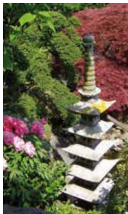
Les Jardins d'Adegem