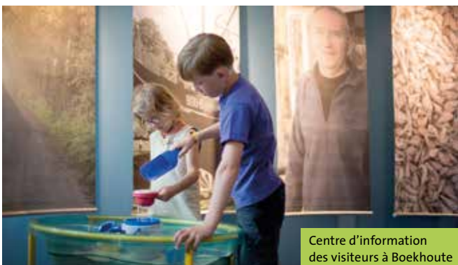
Centre d'information des visiteurs à Boekhoute

● Le village de pêcheurs de Boekhoute est un remarquable petit village de la région du Meetjesland. Le village est situé à 20 km de l'Escaut occidental. Toutefois, le passé des pêcheurs de ce village, qui possédait son propre port de pêche relié à la mer par le chenal Braakman jusqu'en 1953, reste vivant dans les coeurs des habitants de Boekhoute. Plus fort encore, jusqu'au jour d'aujourd'hui, deux pêcheurs boekhoutois sont toujours en activité. Ils partent en effet tous les jours à la pêche au départ des ports de pêche néerlandais de Breskens et de Terneuzen. Découvrez ce village singulier au Centre d'information des visiteurs flambant neuf. Nous vous conseillons de téléphoner avant de vous y rendre.