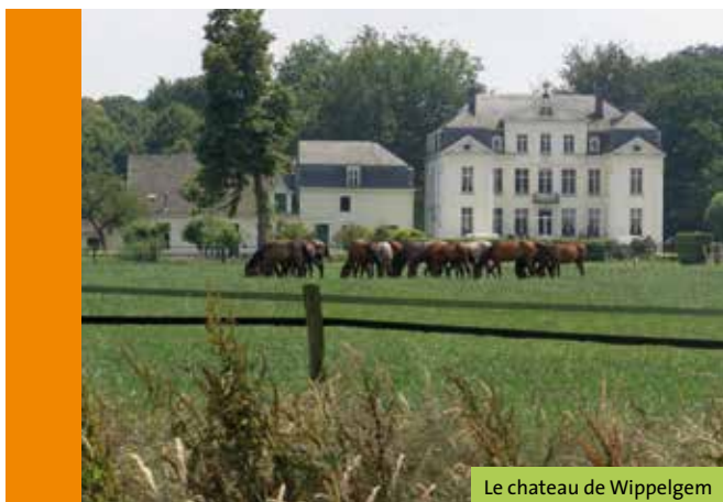
Le château de Wippelgem

Tout près de Gand, le « Goed Ten Hulle » est mieux connu sous le nom de 'Kasteel van Wippelgem' (château de Wippelgem), situé dans la commune du même nom. Sont rassemblées sur le même domaine : une remise, des écuries, une glacière et une maison de jardinier aujourd'hui aménagée en bistro. Ouvert du lever au coucher du soleil. (entre les points de jonction 41 et 46)